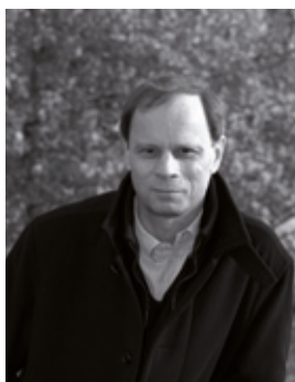
Jean Tirole, Président